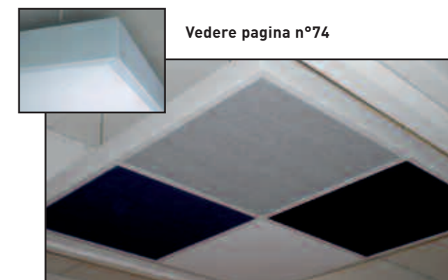
Vedere pagina n°74

Possibilità di messa in opera del controsoffitto ad isola con il sistema API Insula (2400x1200 - 1200x1200mm).